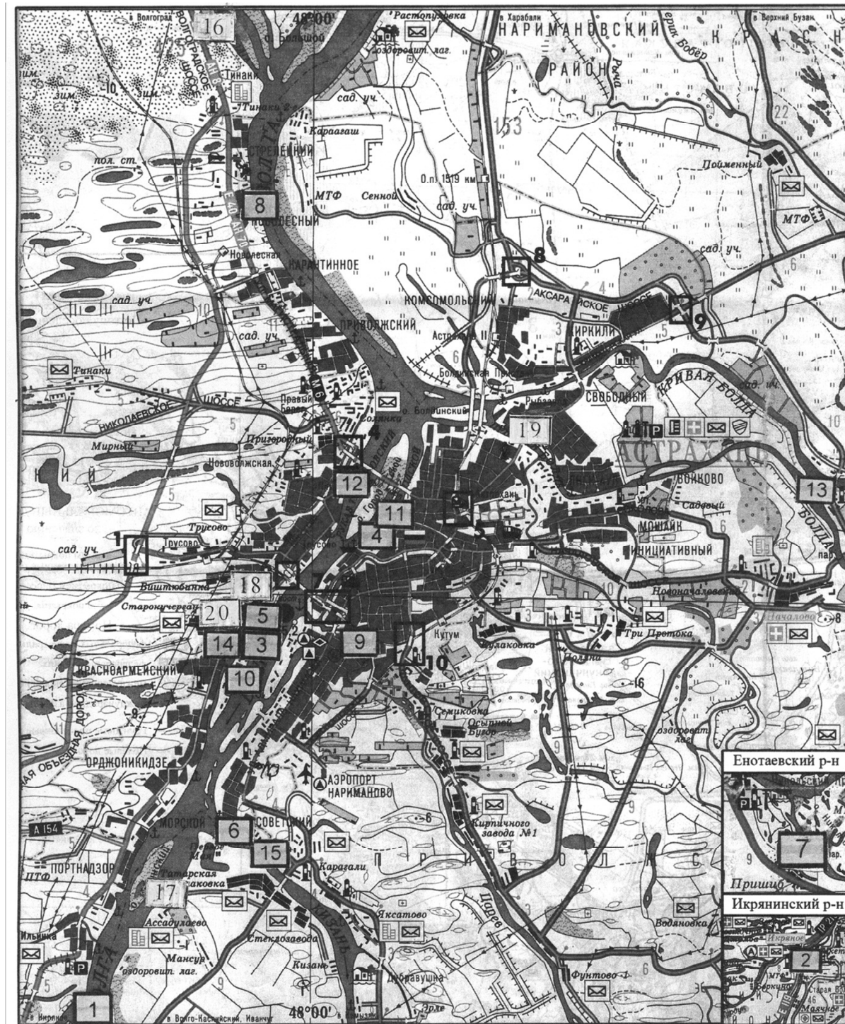
Рис. 1. Карта отбора проб природной воды и плёночных нефтепродуктов в местах аварийных разливов нефтепродуктов

С целью изучения влияния загрязнений водной среды нефтепродуктами непосредственно на живые организмы методами КХА [9] и биотестирования [10] был проведён сравнительный анализ 87 проб природной воды и плёночного нефтепродукта. Пробы были отобраны в окрестностях г. Астрахани в местах аварийных разливов нефтепродуктов в 2013–2015 гг. на водных объектах – реках Волга, Бахтемир, Кизань, Бобёр, Прямая Болда, Кривая Болда, протоке Серебряная Воложка (рис. 1). Установлена кратность превышения ПДК.