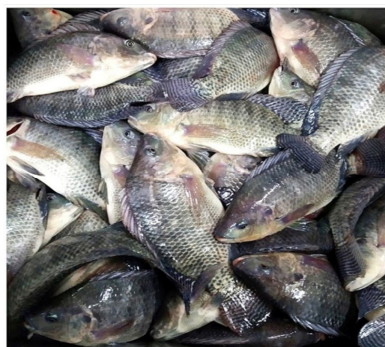
Рис. 1. Объект исследования – тилапия

Тилапия. При выращивании тилапии (рис. 1) большое значение уделяется ее адаптации к условиям содержания.