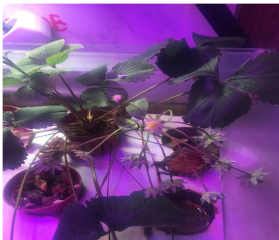
Рис. 2. Выращивание клубники в аквапонической установке

Клубника. Обработку клубники проводили этим же раствором бактериального штамма. Предварительно перед посадкой растений в систему осуществляли замачивание клубней в растворе бактериального штамма. Затем в течение всего эксперимента в опыте вели обработку растений путем опрыскивания каждые 10 дней (рис. 2).