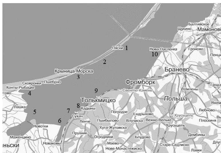
Рис. 1. Карта Вислинского залива с указанием расположения станций

Работа выполнена по материалам, собранным в Вислинском заливе Балтийского моря (на территории Польши) в 1996 г. с мая по август. Траления проводили по всему периметру залива (рис. 1) в горизонте 0–1,5 м. Рыбы были пойманы буксируемой с лодки сеткой Кори и мальковой волокушей. Всего обловлено 10 станций. Северный берег залива ограничен Вислинской косой. Здесь вдоль береговой линии расположены станции Пяски (1), Латарния (2), Пшебрно (3) (Крыница-Морска) и Каты (4) (Конты Рыбацке). В западной части залива траления проводили в эстуарии р. Ногат, которая является крупным рукавом р. Вислы (5). Напротив небольшого залива, образованного в месте впадения р. Эльблонг (юго-западная часть), находится станция Залев Малы (6). Далее на восток, вдоль материкового берега – Сухач (7), Кадыны (8), Толькмицко (9) и Ружанец (10) – эстуарий р. Пасленка (Paslenka). Одновременно с тралением рыб проводили отбор проб зоопланктона и зообентоса как в открытой части залива, так и в прибрежной зоне. Общее количество и соотношение отдельных организмов в них определяли обычным счетным методом в камере Богорова. Обработка собранных материалов проводилась по стандартным методикам [9, 10].