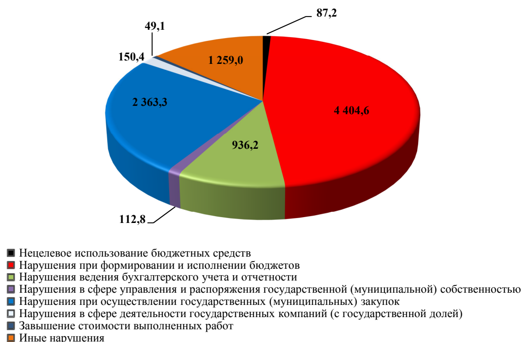
Рис. 2. Структура бюджетно-финансовых нарушений, млн руб.

Анализ структуры бюджетно-финансовых нарушений свидетельствует о том, что в 2018 г. 47,0 % (4 404,6 / 9 362,6 · 100 %) нарушений выявлены в сфере бюджетного процесса; 25,2 % (2 363,3 / 9 362,6 · 100 %) – при организации и проведении государственных (муниципальных) закупок; 10,0 % (936,2 / 9 362,6 · 100 %) – при ведении бухгалтерского учёта и отчётности. Также допущены нарушения в сфере управления федеральным и региональным имуществом, нецелевого расходования финансовых ресурсов в сфере деятельности государственных компаний (с государственной долей) и иные нарушения, данные по которым представлены на рис. 2.