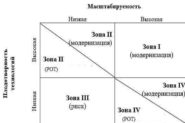
Рис. 2. Матрица стратегических преимуществ рассматриваемых критических технологий