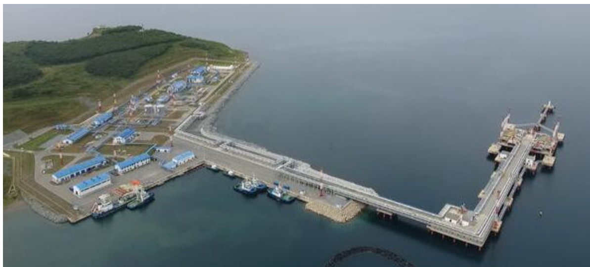
Рис. 1. Пирс с технологической эстакадой (порт Козьмино)

ляются SPM и решение проблемы их безопасной эксплуатации в ледовых условиях шельфа России, в том числе и арктического.