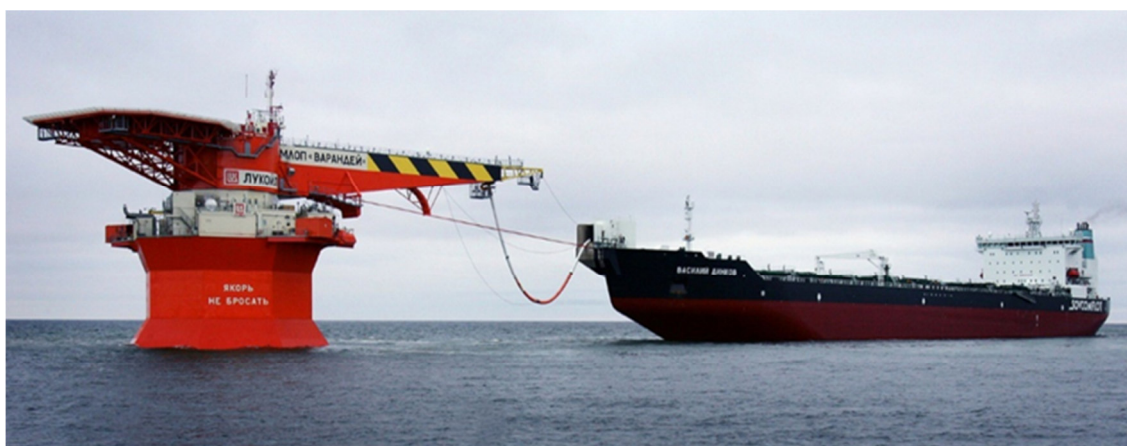
Рис. 3. Погрузка специализированного танкера у SPM башенного типа «Варандей»

когда для доставки груза на танкер применяется не плавающая, а подвесная шланголиния – альтернативный вариант (порты Де-Кастри, Пригородное, «Ворота Арктики», «Варандей»).