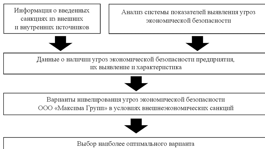
Рис. 3. Предлагаемая система сглаживания угроз экономической безопасности ООО «Максима Групп» в условиях внешнеэкономического давления

Предлагаемая система сглаживания угроз с указанием основных элементов и связей между ними приведена на рис. 3.