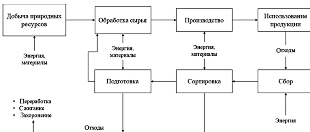
Рис. 2. Блок-схема системы управления потоками отходов