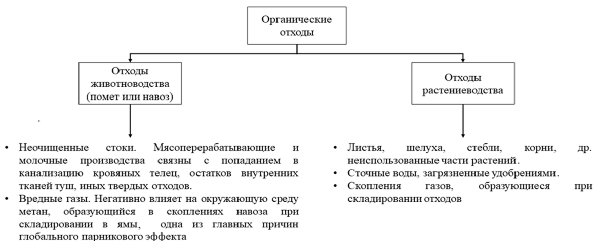
Рис. 1. Классификация органических отходов сельскохозяйственного комплекса

Различают два вида органических отходов: отходы животноводства и растениеводства. Классификация данных отходов представлена на рис. 1.